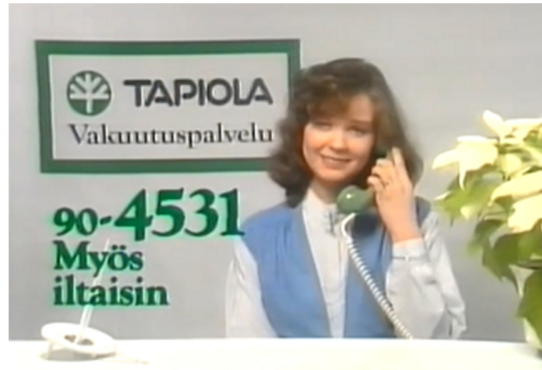
Yksi ja kaksi – Tapiolaksi

Tapion päivänä 18.6.1982 Aura ja Pohja fuusioituivat. Tapiolana yhtiöryhmä alkoi toimia vuonna 1984. Tampereelta johdettavaksi tuli Tapiolan silloinen Länsi-Suomen alue. Tapiola saavutti nopeasti hyvän työnantajan maineen. Pitkäaikaisia työsuhteita oli paljon ja työntekijöistä pidettiin kiinni myös vaikeina aikoina. Henki oli hyvä ja kannustava. Sekä sisäisesti että ulkopuolisten voimin tehdyt ilmapiirikartoitukset kertoivat tästä vuosi toisensa jälkeen. Tapiolasta kasvoi Pirkanmaalla vahva yhteiskunnallinen vaikuttaja, joka osallistui monin tavoin aktiivisesti paikalliseen liike- ja kulttuurielämään. Yhteiskunnallinen vaikuttaminen, sidosryhmäsuhteiden hoitaminen ja osallistuminen paikkakunnan toimintaan muussakin kuin bisnesmielessä koettiin äärettömän tärkeänä toiminnan osa-alueena.