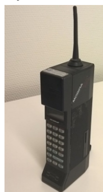
Yhtiössä käytössä olleet IBM-tietokone ja Mobiran puhelin

1980-luvulle tultaessa vakuutusosalalla Auran ja Pohjan kanssa kilpailevat palovakuutusyhdistysten jälleenvakuuttajat Vakava ja Sampsa päättivät yhdistyä Vakava-Sampsaksi. Liikennevakuuttamisesta oli tuolloin tullut vakuutusyhdistyksille merkittävä tulonlähde. Vakuutusyhtiö ARA kilpaili liikennevakuutuksista omalla erikoisella tavallaan. ”Raittiiden yhtiöksi” kutsuttu ARA myönsi asiakkailleen liikennevakuutuksesta alennusta, kun asiakas allekirjoituksellaan tuva ARA sulautui Vakava-Sampsaan. Koska yhtiön nimeksi ei mitenkään voitu antaa Vakava-Sampsa-ARA päätettiin yhtiö nimetä Lähivakuutukseksi. Siitä tuli vakava kilpailija Aura- ja Pohja-yhtiöille.