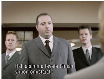
Nobody can buy this company

Lähivakuutus-ryhmässä keskinäinen omistus pohja haluttiin säilyttää vahvana, vaikka kasvu- paine suurten kaupunkien suuntaan oli edelleen kova. Lähivakuutuksen asema oli vahva haja- asutusalueilla ja pienissä kaupungeissa. 1970-luvulla alkoi pirkanmaalaisten palo- ja lähiva- kuutusyhdistysten fuusioituminen jatkui aina vuoteen 1996, jolloin perinteikäs ja vahvasti paikallisuuteen perustuva toimija muutti nimensä Pirkanmaan Lähivakuutusyhdistykseksi. Lähivakuutuksesta muodostui Pirkanmaalle vahva, oman tiensä kulkija, jolle tärkeää oli toi- minnan kannattavuus ja prosessien tehokkuus, alueellisen itsenäisyyden korostaminen, hen- kilöstön osaamiseen panostaminen sekä näkyvä markkinointi ja läsnäolo erityisesti urheilun ja liikunnan parissa.