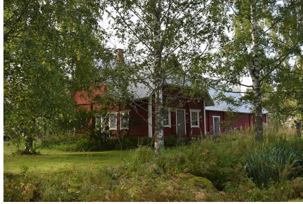
Ruoweden pitäjän erinäinen Paloapuyhdyskunnan ensimmäinen palovakuutus myönnettiin Ylä-Hanhon tilan pihapiirin rakennuksille.